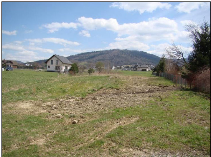
Fot. 1 Analizowany teren, widok w kierunku południowo-wschodnim