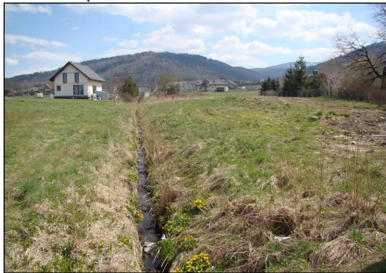
Fot. 4 Ciek płynący przez południowo-wschodnią część terenu