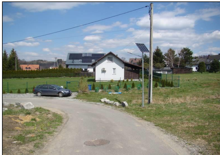
Fot. 3 Północna część terenu