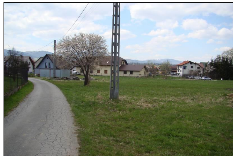
Fot. 7 Teren nr 2, widok w kierunku zachodnim