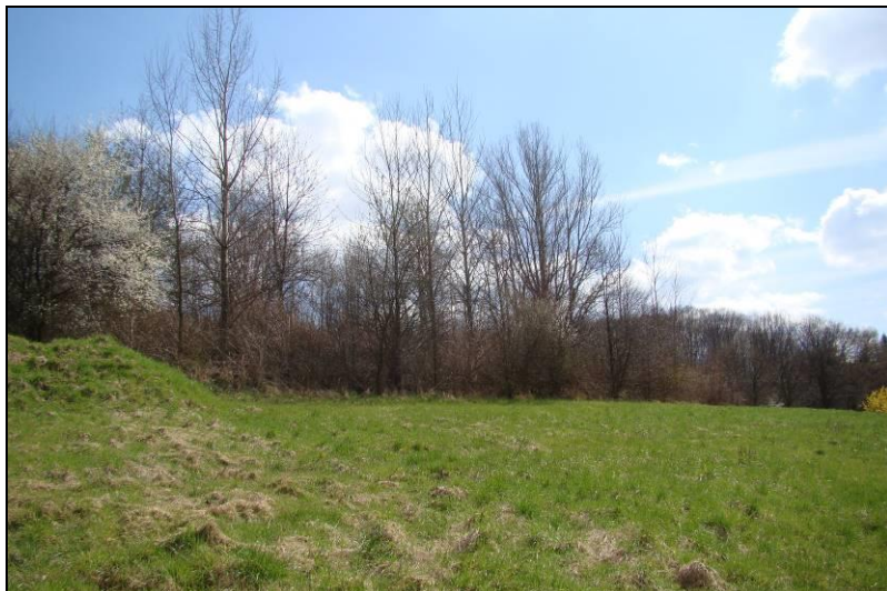
Fot. 1 Teren nr 1, widok w kierunku południowo-wschodnim