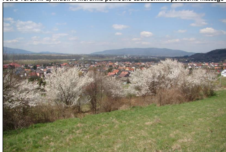
Fot. 4 Teren nr 1, widok w kierunku północno-zachodnim z położenia wyższego