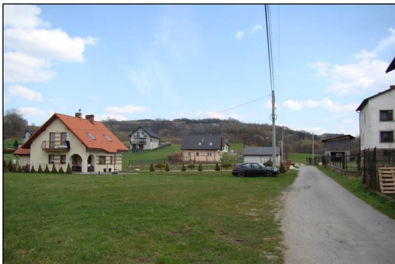
Fot. 5 Teren nr 2, widok w kierunku wschodnim