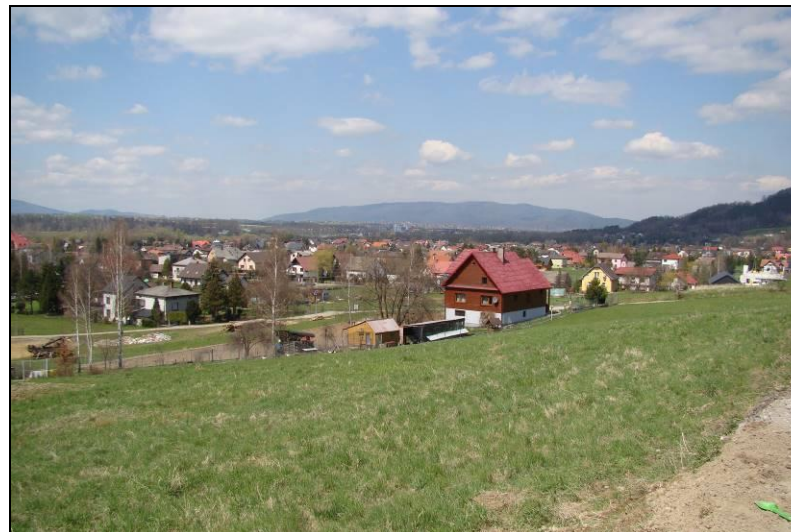
Fot. 3 Teren nr 1, widok w kierunku północno-zachodnim z położenia niższego