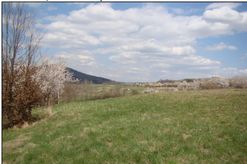
Fot. 2 Teren nr 1, widok w kierunku północnym