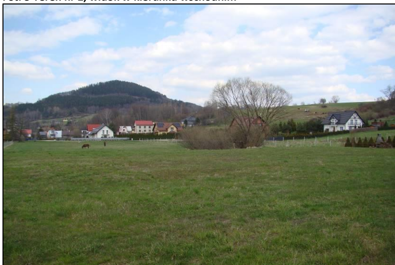
Fot. 6 Teren nr 2, widok w kierunku północnym