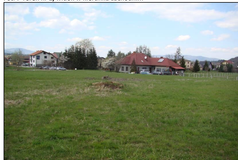
Fot. 8 Teren nr 2, widok w kierunku północno-zachodnim