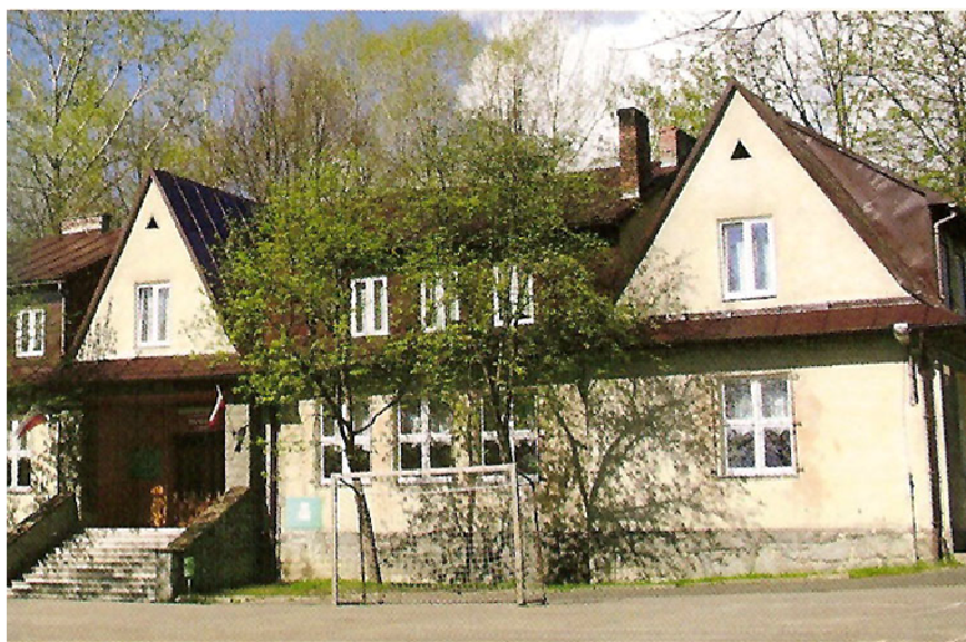
Fotografia 11. Szkoła Podstawowa w Zespole Szkolno-Przedszkolnym w Przybędzy

W Szkole Podstawowej jest zatrudnionych 10 nauczycieli, w tym 6 dyplomowanych i 8 posiadających dodatkowe kwalifikacje.