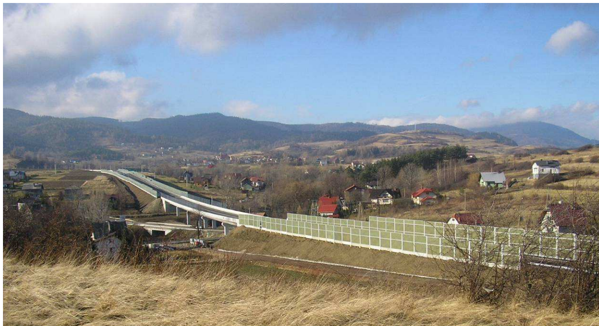
Fotografia 5. Droga ekspresowa S69 w Przybędzy

Wieś Przybędza zlokalizowana jest przy drodze krajowej 69 (drodze ekspresowej S69) Bielsko-Biała - Zwardoń. Wieś oddalona jest od Żywca – o 10 km, od Bielska-Białej - o 33 km i od granicy ze Słowacją w Zwardoniu – także o 33 km.