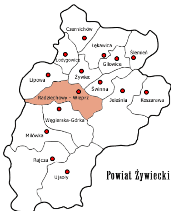
Fotografia 1. Lokalizacja Gminy Radziechowy-Wieprz w Powiecie Żywieckim

Wieś Przybędza należy do Gminy Radziechowy-Wieprz, położonej w południowej części województwa śląskiego w powiecie żywieckim, w sąsiedztwie gmin: Lipowa, Żywiec, Świnna, Jeleśnia, Węgierska Górka i Milówka. Wieś graniczy od południa z Węgierską Górką, od północy z Radziechowami, a od wschodu z rzeką Sołą, malowniczym zakątkiem Podczerwieńcem, gdzie wzdłuż rzeki Soły znajduje się około 10 gospodarstw domowych.