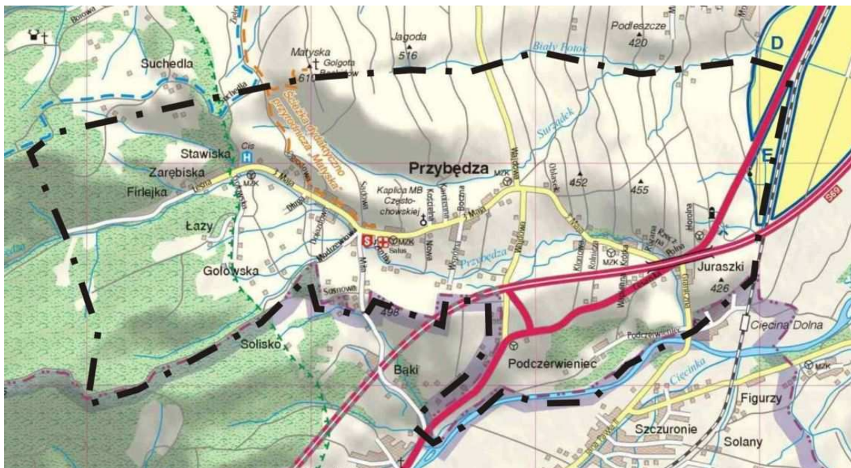
Fotografia 3. Mapa miejscowości Przybędza