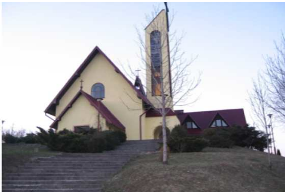
Fotografia 9. Kaplica pw. Matki Boskiej Częstochowskiej