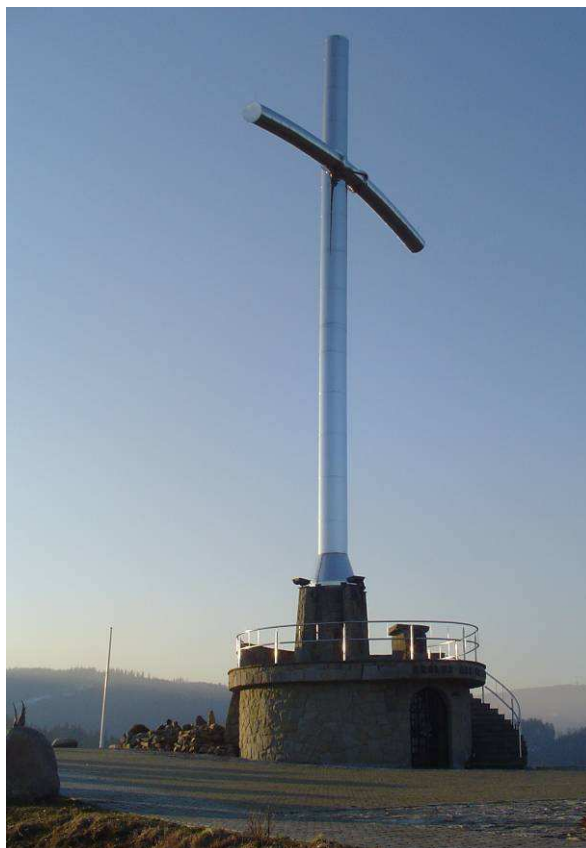
Fotografia 8. Krzyż Millenijny na szczycie