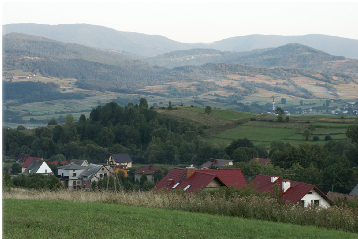
Fotografia 6. Piękne widoki w Przybędzy