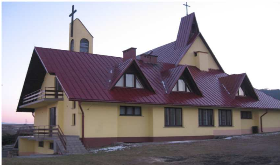
Fotografia 4. Kaplica p.w. Matki Boskiej Częstochowskiej

Dominantą przestrzenną miejscowości Przybędza jest Kaplica pw. Matki Boskiej Częstochowskiej zlokalizowana w centrum wsi. Osadzona na czteroboku, z charakterystyczną wieżą wieńczącą całą konstrukcję, kaplica ta jest przykładem umiejętnego połączenia nowoczesnej architektury z elementami stylu regionalnego. Budowę Kaplicy, dzięki inicjatywie i pomocy Mieszkańców, rozpoczął w 1983 roku ks. Proboszcz Stanisław Gawlik.