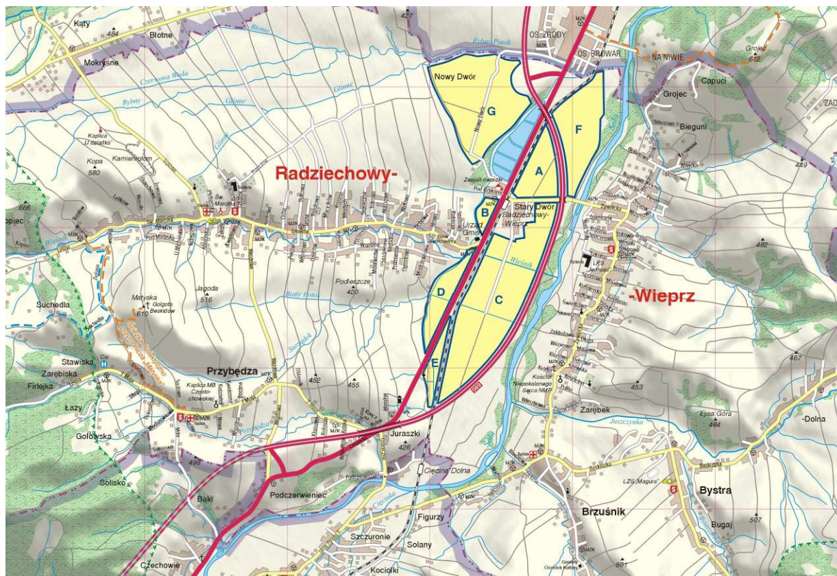
Fotografia 2. Lokalizacja Przybędzy w Gminie Radziechowy-Wieprz.

występowanie gwałtownych wezbrań i okresów niżówek. Ta naturalna cecha cieków beskidzkich została pogłębiona przez wylesienia i przekształcenia składu gatunkowego i struktury lasów.