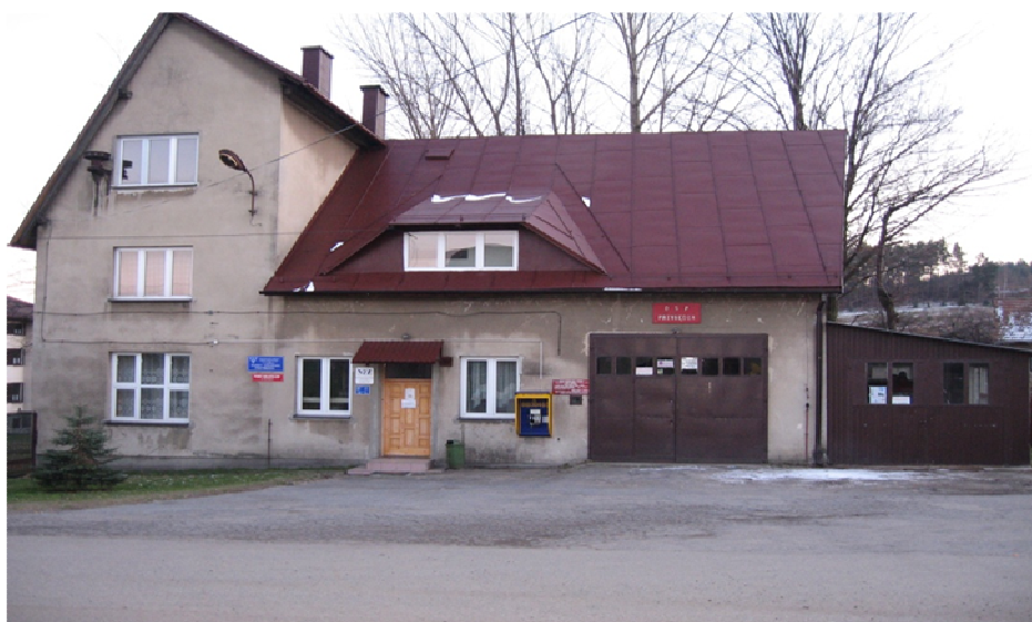
Fotografia 12. Ochotnicza Straż Pożarna w Przybędzy.

Na terenie wsi Przybędza działa jednostka Ochotniczej Straży Pożarnej, która istnieje od 1956 roku i prowadzi działalność w zakresie ratownictwa gaśniczego oraz powodziowego. W jednostce pełni służbę 25 strażaków ochotników. Na wyposażeniu jednostki są 2 samochody bojowe wraz ze standardowym wyposażeniem (Ford Transit i Magirus Deuc z autopompą). Na wyposażeniu znajdują się również 3 motopompy. W budynku Ochotniczej Straży Pożarnej znajduje się zaplecze techniczne, garaż oraz sala (ok. 40m).