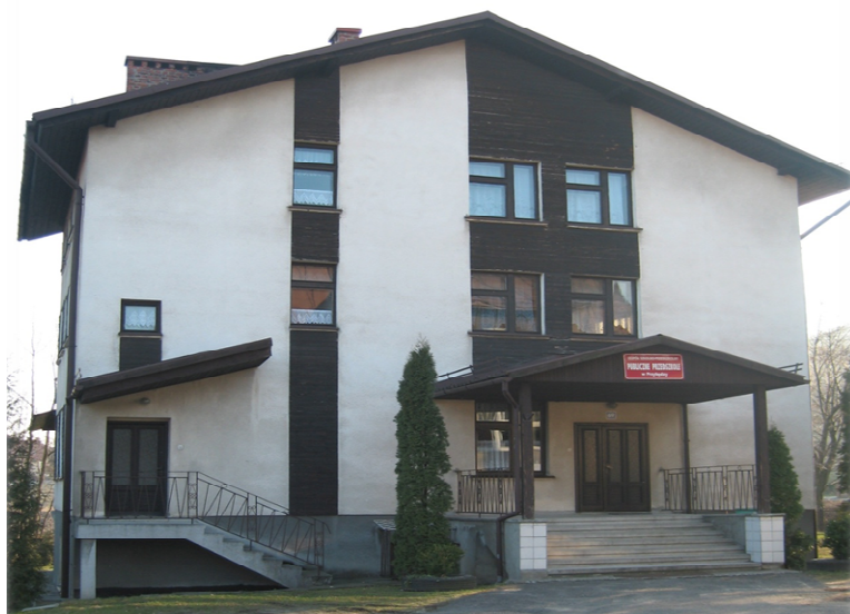
Fotografia 10. Przedszkole w Przybędzy